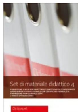
Set di materiale didattico 4 LIGHT (CFP)