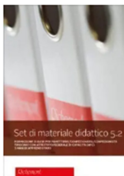
Set di materiale didattico 5.2 LIGHT (Indirizzo professionale pasticceria-confetteria)