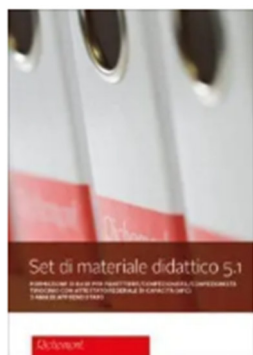
Set di materiale didattico 5.1 LIGHT (Indirizzo professionale panetteria-pasticceria)

Clicca su «SET DI MATERIALE DIDATTICO» e cerca il pacchetto didattico adatto.