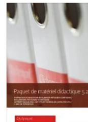
Paquet de matériel didactique 5.2 LIGHT (Orientation pâtisserie-confiserie)