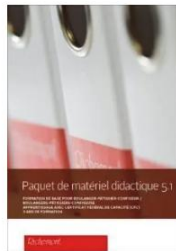
Paquet de matériel didactique 5.1 LIGHT (Orientation boulangerie-pâtisserie)