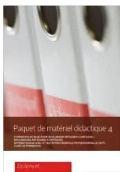
Paquet de matériel didactique 4 LIGHT (AFP)

Défiler vers le bas sur « PAQUET DE MATÉRIEL DIDACTIQUE »