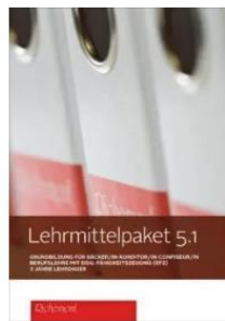
Lehrmittelpaket 5.1 LIGHT (Fachrichtung Bäckerei-Konditorei)