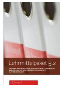
Lehrmittelpaket 5.2 LIGHT (Fachrichtung Konditorei-Confiserie)