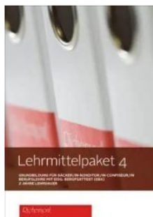
Lehrmittelpaket 4 LIGHT (EBA)

Auf „ LEHRMITTELPAKET “ klicken und passendes Lehrmittelpaket suchen.